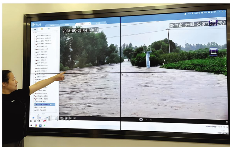
水文预报技术人员通过智慧水文系统研判水情

筑牢安全防线,让水文服务更好惠及人民群众。 智慧水文系统的应用对防汛应急指挥、领导决策、河流水文监测及山洪灾害预警、预报,保障人民生命财产安全的安全发挥了重要作用。2022年7月7日受减弱热带低压“暹芭”水汽与高空槽结合共同影响,吉林市中西部鳌龙河流域出现大暴雨。智慧水文平台在抢险救灾工作中发挥作用成效显著,实时收到鳌龙河大桥、唐家屯、骆起等水文(水位)站水文信息210多条,为永吉县、吉林市船营区、昌邑区等地方政府提前疏散转移人员争取了宝贵的时间。□