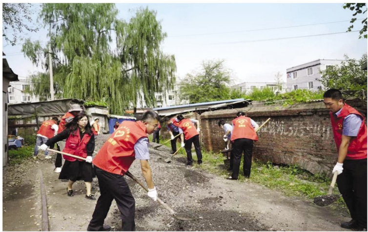
党总支多方筹措路料,与社区工作人员齐心协力铺平坑洼道路,解决了困扰群众多年的出行难题

深入开展“我为群众办实事”和“微心愿”认领活动,聚焦各类“关键小事”,切实为群众排忧解难。今年年初,党总支在工作中发现共建社区辖区内连接铁路三角线与建设大街的纽带的铁路天桥及通往天桥的共建社区缺少照明设施,并且共建社区内道路坑洼不平,严重影响居民出行安全,该天桥是周边3000多户居民日常出行的必经之路。为保障居民出行安全,第一、第二党支部的党员干部以认领“微心愿”的形式,自愿捐款,购买了太阳能路灯,并与铁路部门携手合作,在天桥桥头两侧及共建社区安装了路灯,照亮了居民回家路。为解决社区内道路坑洼难题,党总支积极联系相关责任部门,确