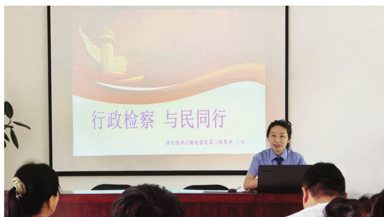
党员干部走进结对共建社区开展以反家暴、防诈骗、行政检察以及保密知识等为主题的普法讲座

通化铁路运输检察院将继续坚持以人民为中心的发展思想,能动履职,把“党建+业务”的融合成效体现到强化主责主业、保障民生民利的根本上。以“检护民生”专项行动为抓手,用心、用情做实人民群众可感受、能体验、得实惠的检察为民。□