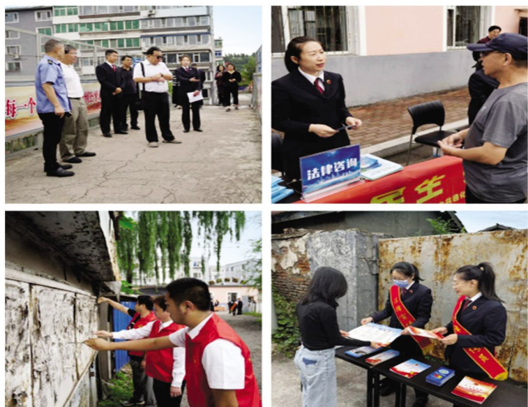
党总支结合“检护民生”活动,开展了形式多样的志愿活动,点亮为民服务承诺

认权属,划分责任。经与市政、铁路等部门多次座谈,最终双方达成共识,确定铺路材料和施工方案。9月,60余吨的铺路材料被送到了现场,我院党员干部、社区工作人员以及三十余名热心的居民,齐心协力,铺设一条厚度达10厘米、长度达130米的道路,解决周边群众的出行难题。