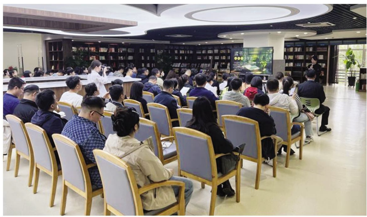
举办市直机关青年干部读书论坛

抓实研习阵地。积极策划构建“导学、讲学、研学、比学、践学、廉学”六位一体学习体系,创新载体、搭建平台,开展学习贯彻党的二十大精神知识竞赛和“青学讲堂”访谈分享、