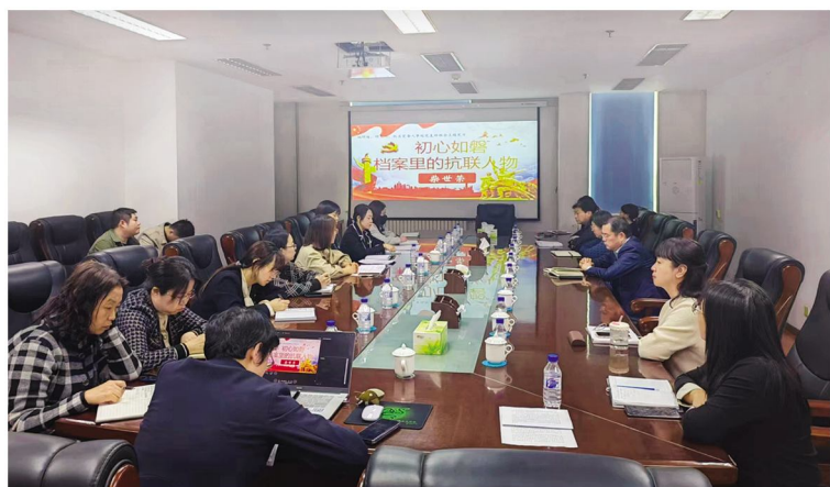
首期“初心如磐——档案中的抗联英雄”主题党日活动

三、取得真实效，贯通联结点。省档案馆全力推动档案编研工作守正创新，深入挖掘馆藏珍贵档案资源，形成了一批有深度、有分量、有价值的研究成果。据统计，自建馆以来，吉