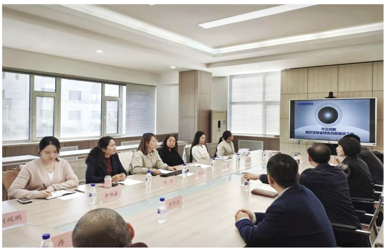
省档案馆与吉林大学档案馆开展联学共建活动

二、发挥档案优势,构建高质量发展“思想库”。省档案馆把党建作为档案工作与中心工作融合的有效载体,通过加大档案资政研究力度,切实把“死档案”变为“活资源”、把“档案库”变为“思想库”,从而推动新时代档案工作在党委、政府工作大局中贴得紧、跟得上、抓得